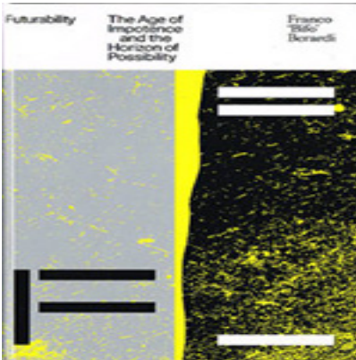
Franco 'Bifo' Berardi – Futurability