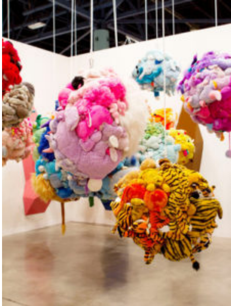
Een ander bekend kunstwerk van Mike Kelley

voeden, te vervormen, daarop vooruit te lopen. Kelley doet er alles aan om als kunstenaar zoveel mogelijk het probleem op tafel te krijgen, om het onderwerp zo sterk mogelijk aan te snijden. Kelley is een groot creatieveling als het gaat om het zoveel mogelijk benutten van alle gelegenheden die zich voordoen. Dus als er iets wordt gesuggereerd over trauma's door critici, en als hij op dat moment juist in aanraking komt met architectonische modellen en dergelijke: tja, dan weet hij dat ook dusdanig bij elkaar te brengen dat het een dergelijk interessant project oplevert.